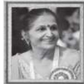
मं.स्व. मंजुलालेन कांतिलाव निसर