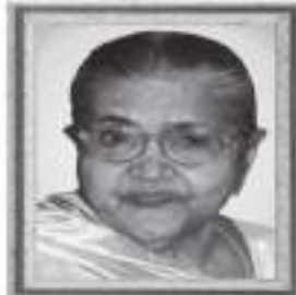
मातुश्री जिवाजीलेन हिरजु निसर