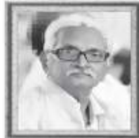
कीमान कांतिलाव हिरजु निसर